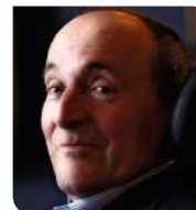
Philippe Pozzo di Borgo Écrivain